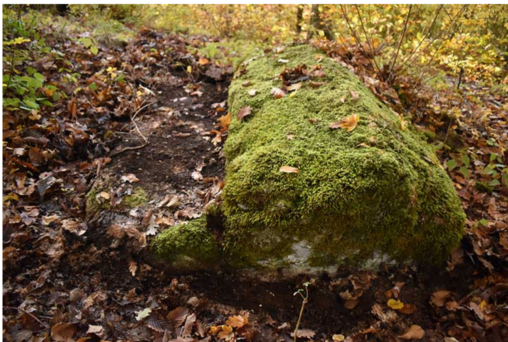
Dvostruki/dvojni stećak, pod rednim brojem 7