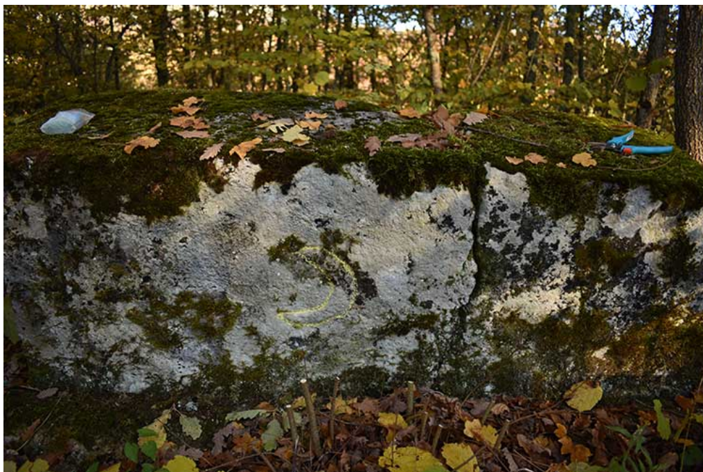
Stećak pod rednim brojem 9, sa ukrasom polumjeseca